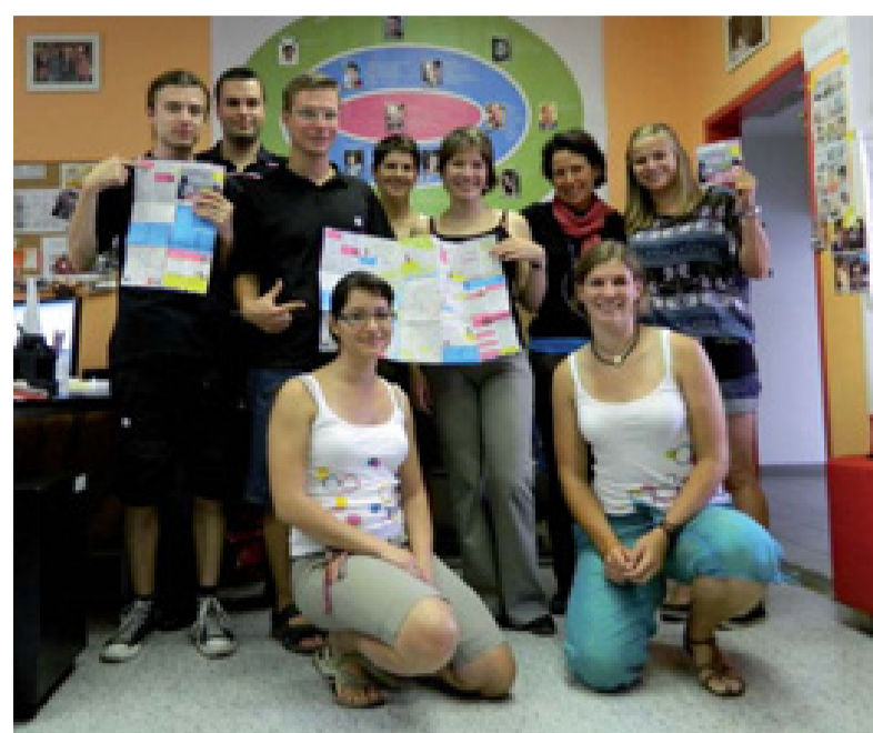
Setkání členů realizačního týmu USE-IT Prague se zástupci týmů z Budapešti, Košic a Bratislavy.

Projekt USE-IT Prague je součástí evropské organizace USE-IT Europe, která zahrnuje síť přibližně dvaceti evropských měst a je prvním v České republice. Jedná se o vytvoření výjimečné mapy hlavního města Prahy, která bude zaměřena na mladé zahraniční cestovatele. V rámci projektu se snažíme ukázat cestovatelům jiný pohled na Prahu než klasické turistické průvodce. Cílem projektu jsou doporučení pro mladé cestovatele jak si užít návštěvu Prahy i s malým rozpočtem. Pro účely této mapy byly vytvořeny mapové podklady v programu ArcGIS, část podkladů byla převzata a upravena, zbytek byl vektorizován podle leteckých snímků Prahy.