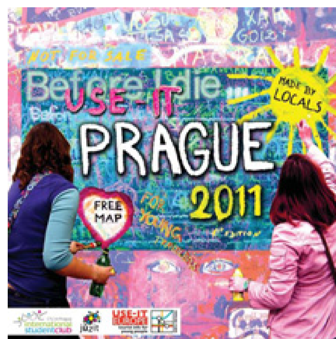
Obálka mapy - upravená fotografie z workshopu u John Lennon Wall