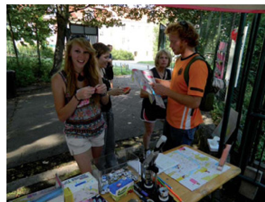
Distribuce mapy v letním info-stanu na Újezdě