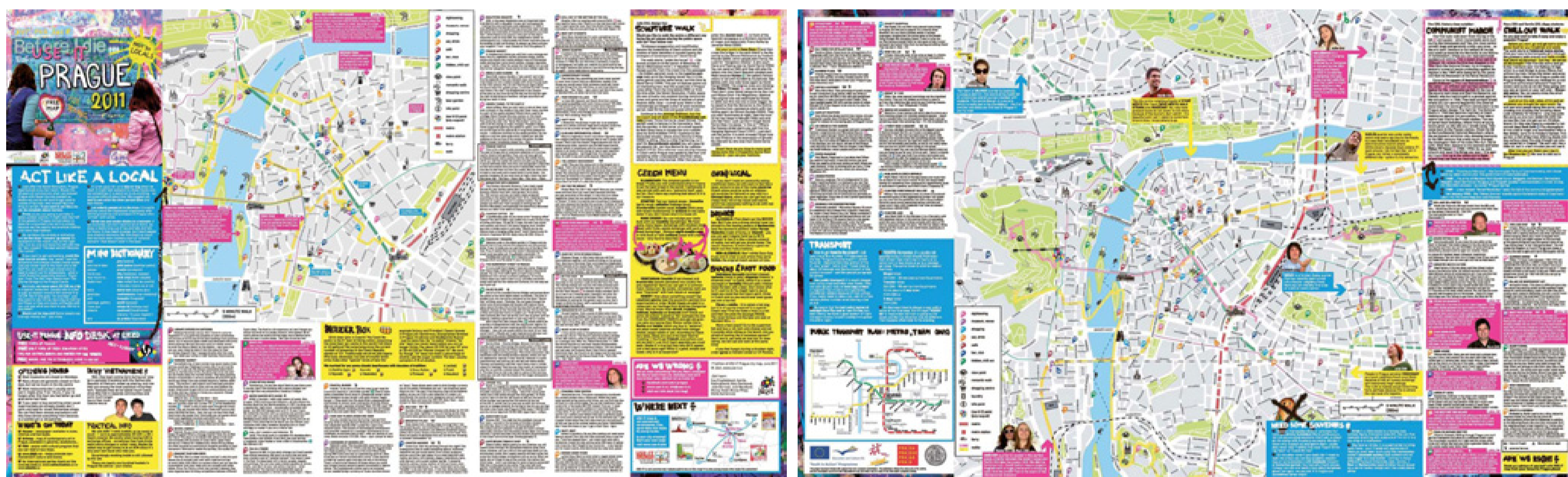
Zmenšený náhled kompletního listu, strana s přebílkou a výřezem centra

USE-IT EUROPE tourist info for young people júzit